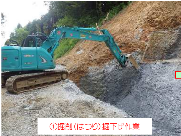
①掘削(はつり)掘下げ作業