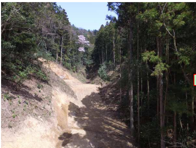
ダム部分 着手前(3月)