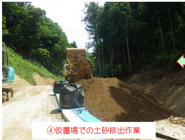
④仮置場での土砂排出作業