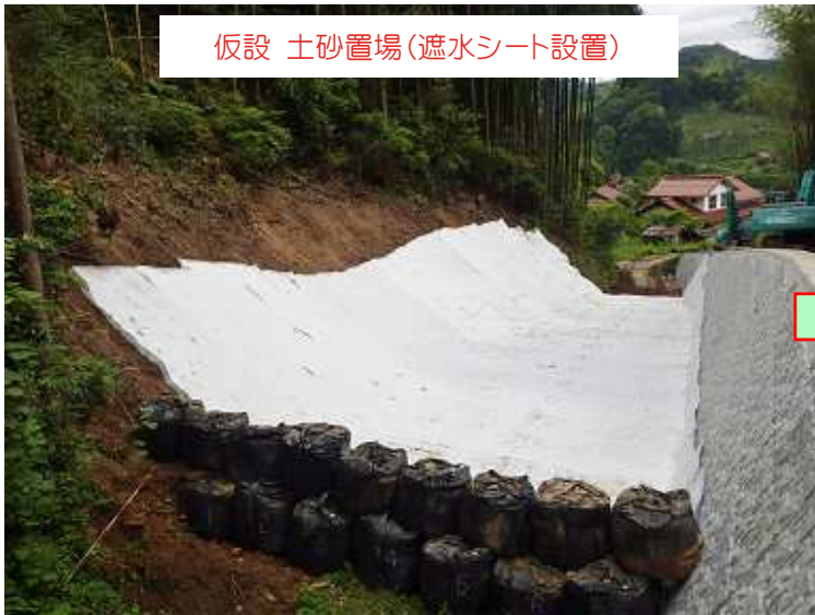
仮設 土砂置場(遮水シート設置)