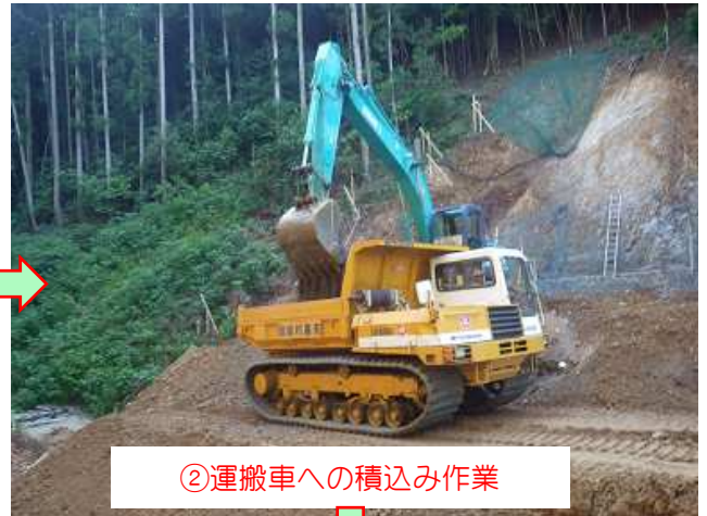
②運搬車への積み込み作業