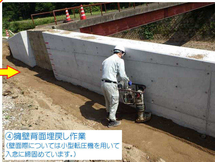
④擁壁背面埋戻し作業 (壁面際については小型転圧機を用いて入念に締固めています。)