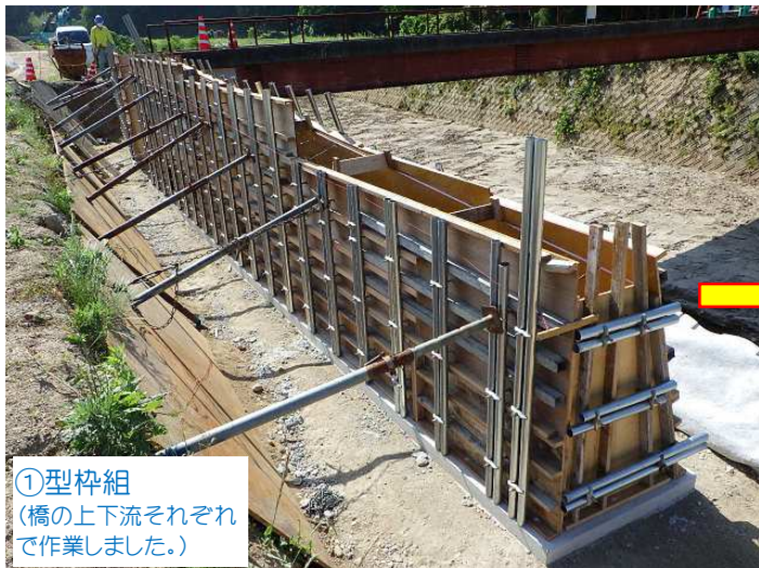
①型枠組 (橋の上下流それぞれで作業しました。)