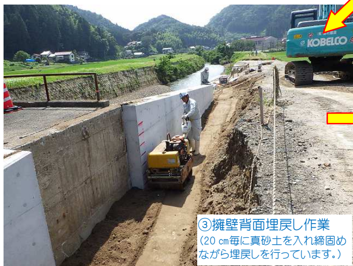
③擁壁背面埋戻し作業 (20cm毎に真砂土を入れ締固めながら埋戻しを行っています。)