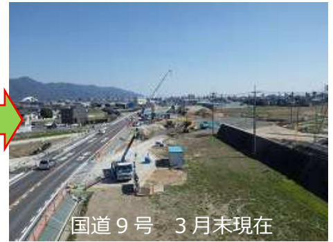
国道 9 号 3 月末現在