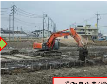
⑤ 改良作業 (攪拌・混合)