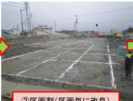
② 区画割 (区画毎に改良)