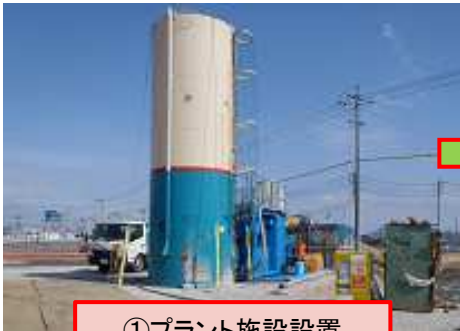
① プラント施設設置