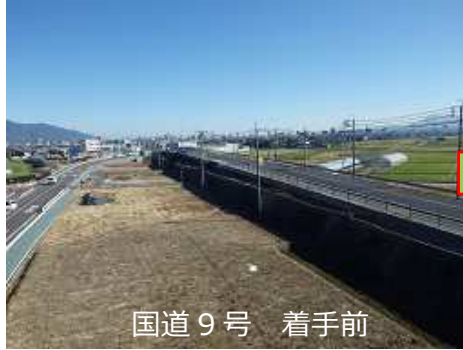
国道 9 号 着手前