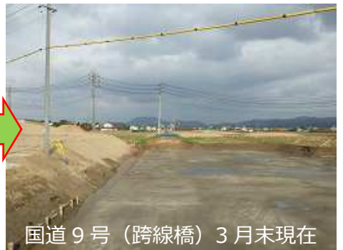
国道 9 号 (跨線橋) 3 月末現在