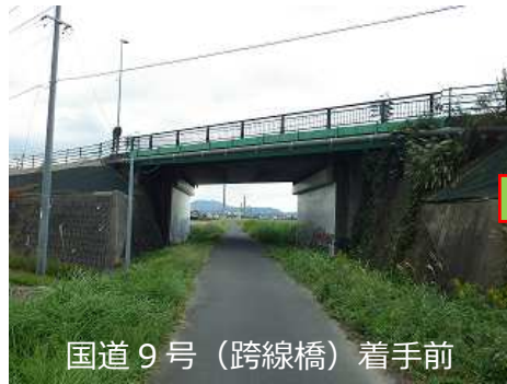
国道 9 号 (跨線橋) 着手前