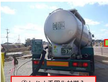
④ セメント系固化材搬入