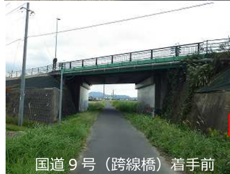
国道9号（跨線橋）着手前