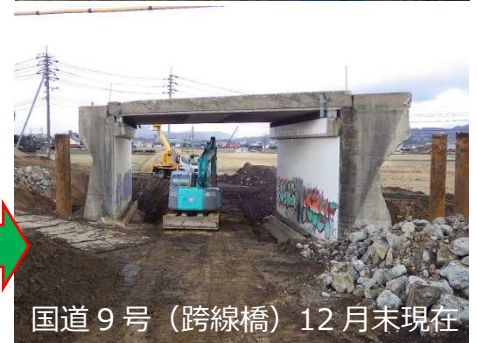
国道9号（跨線橋）12月末現在